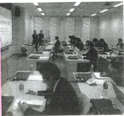
ロボット技術の情報収集など事業内容を確認した総会

研究会には、会川鉄工(いわき市)を中心にバッテリー製造の東洋システムやソフトウェア開発のフォワード、広野町に工場を構えるプリント電子研究所などの企業が出た。また、福島高専や研究組織も含め、約30団体が参加した。